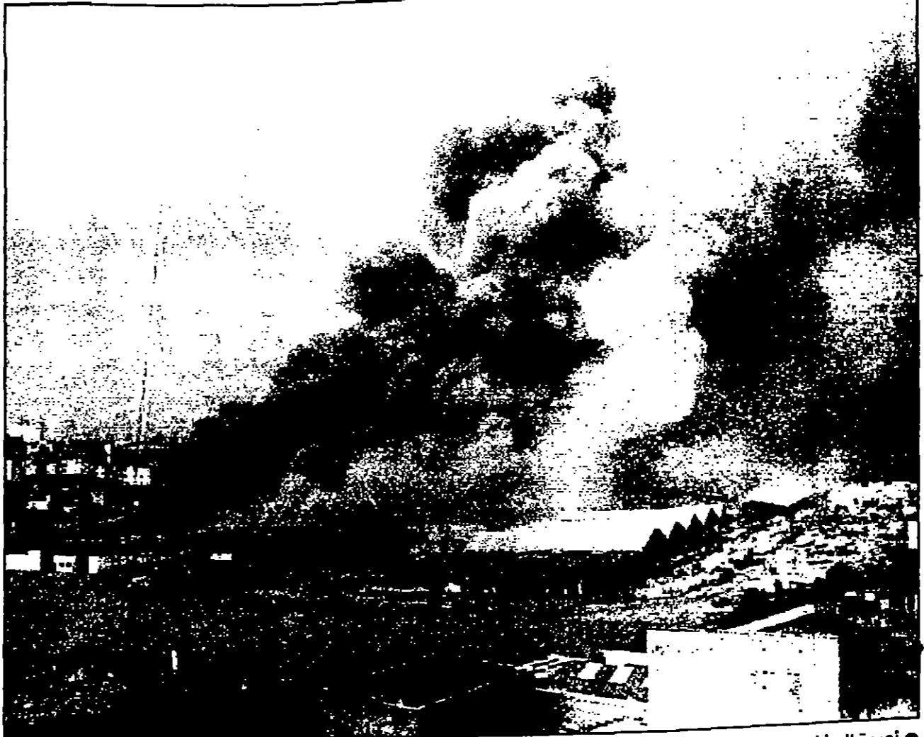
أعمدة الدخان تتصاعد من المسلخ في العاصمة البلجيكية بروكسل بعد أن شبت فيه النيران أمس الأول